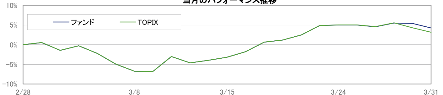
当月のパフォーマンス推移

※ 上記のグラフは過去のものであり、将来の運用成果を保証するものではありません。