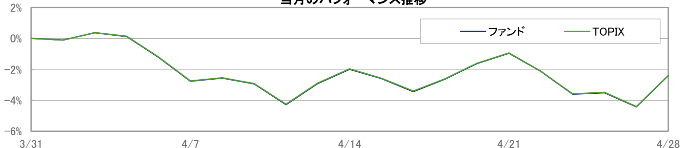
当月のパフォーマンス推移

※ 上記のグラフは過去のものであり、将来の運用成果を保証するものではありません。