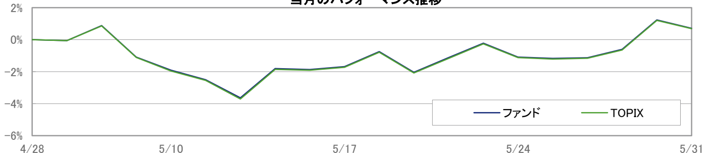
当月のパフォーマンス推移

※ 上記のグラフは過去のものであり、将来の運用成果を保証するものではありません。