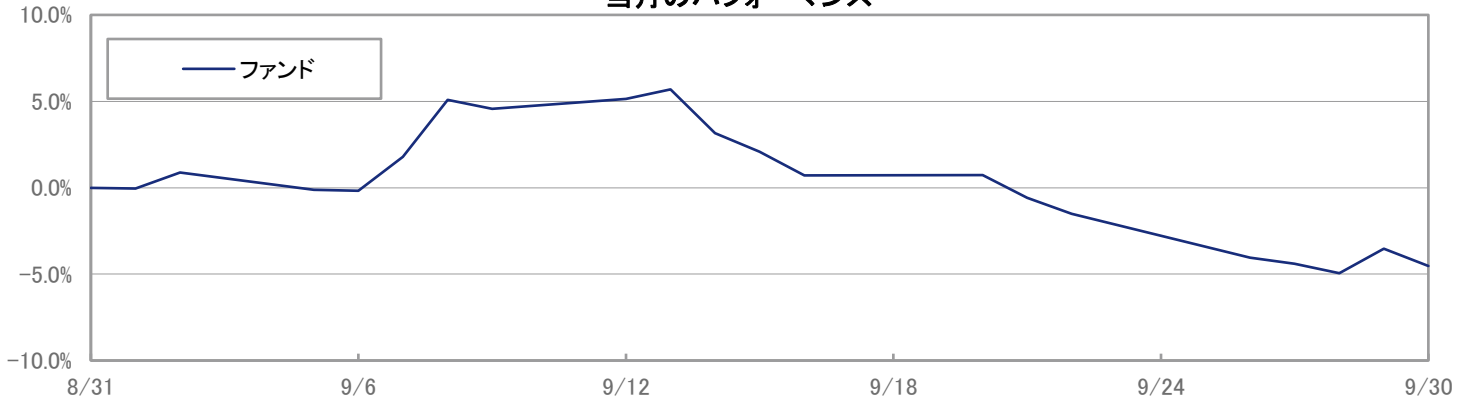
当月のパフォーマンス

※ 上記のグラフは過去のものであり、将来の運用成果を保証するものではありません。