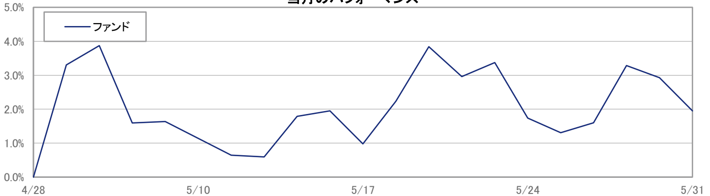
当月のパフォーマンス

※ 上記のグラフは過去のものであり、将来の運用成果を保証するものではありません。