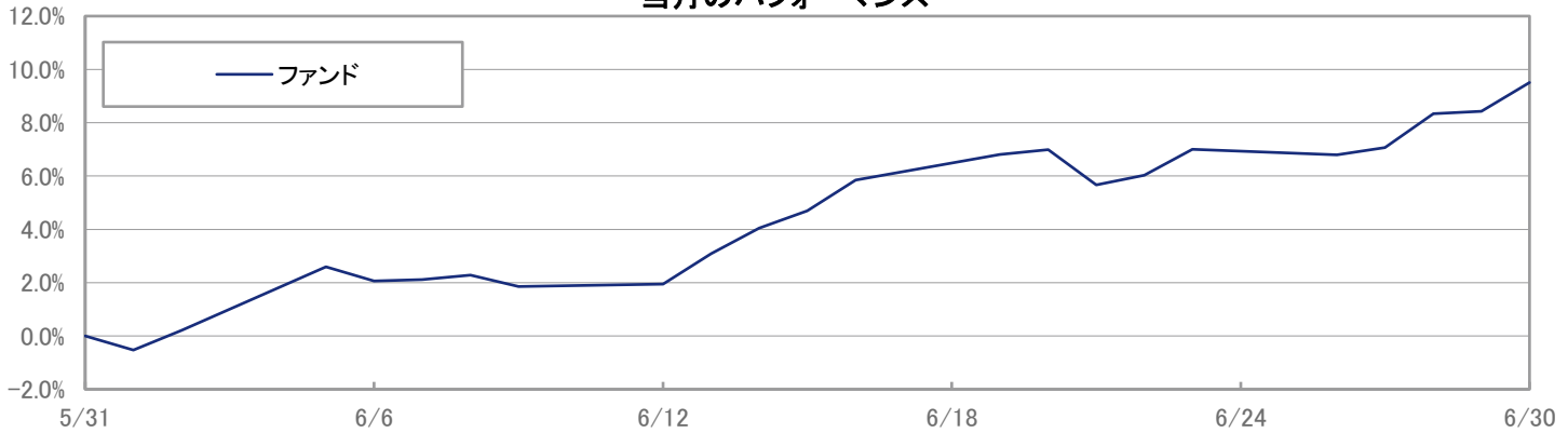
当月のパフォーマンス

※ 上記のグラフは過去のものであり、将来の運用成果を保証するものではありません。