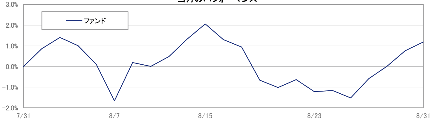
当月のパフォーマンス

※ 上記のグラフは過去のものであり、将来の運用成果を保証するものではありません。