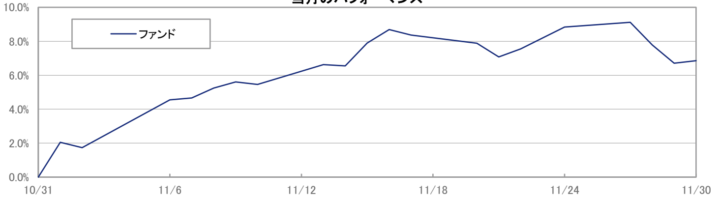
当月のパフォーマンス

※ 上記のグラフは過去のものであり、将来の運用成果を保証するものではありません。