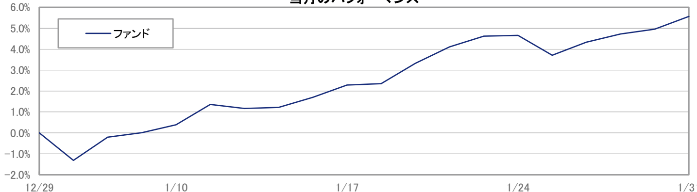
当月のパフォーマンス

※ 上記のグラフは過去のものであり、将来の運用成果を保証するものではありません。