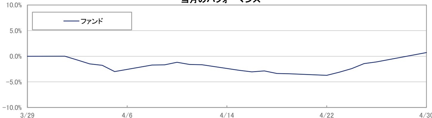
当月のパフォーマンス

※ 上記のグラフは過去のものであり、将来の運用成果を保証するものではありません。