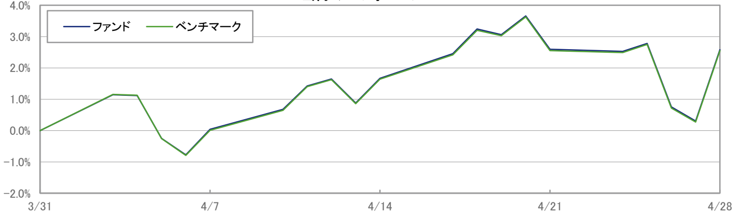
当月のパフォーマンス

※ 上記のグラフは過去のものであり、将来の運用成果を保証するものではありません。