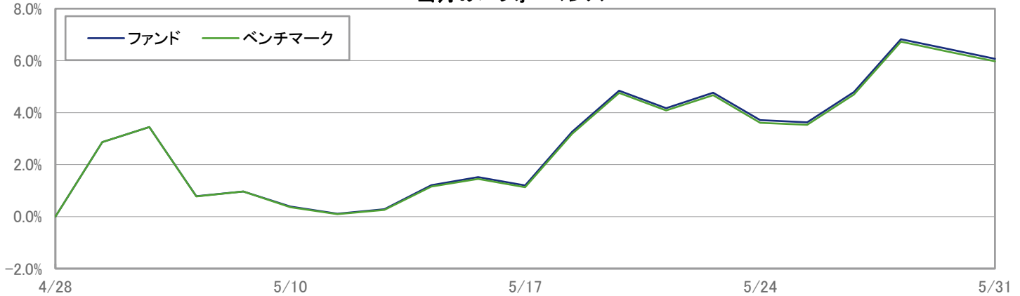
当月のパフォーマンス

※ 上記のグラフは過去のものであり、将来の運用成果を保証するものではありません。