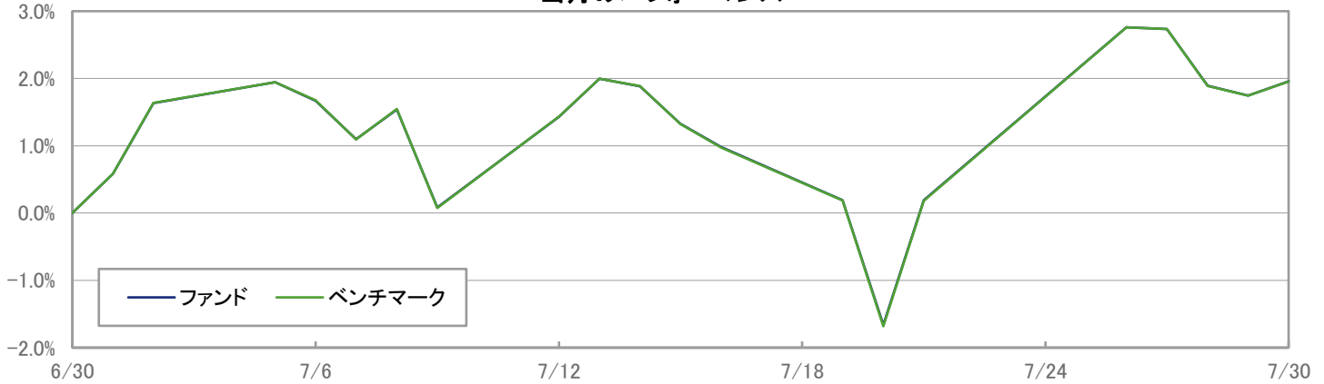
当月のパフォーマンス

※ 上記のグラフは過去のものであり、将来の運用成果を保証するものではありません。