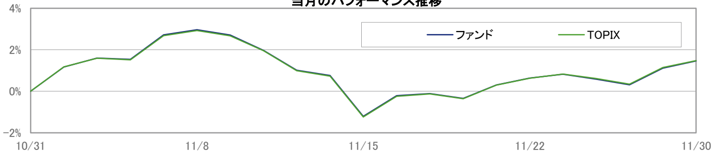
当月のパフォーマンス推移

※ 上記のグラフは過去のものであり、将来の運用成果を保証するものではありません。