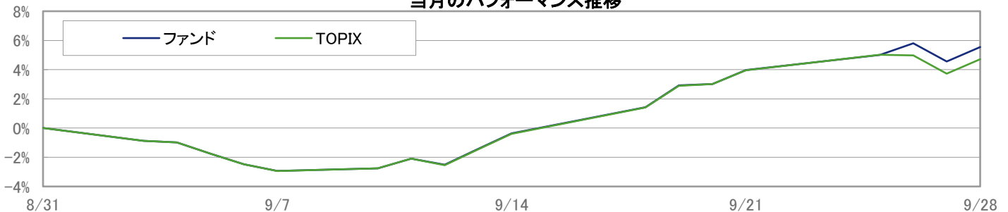
当月のパフォーマンス推移

※ 上記のグラフは過去のものであり、将来の運用成果を保証するものではありません。