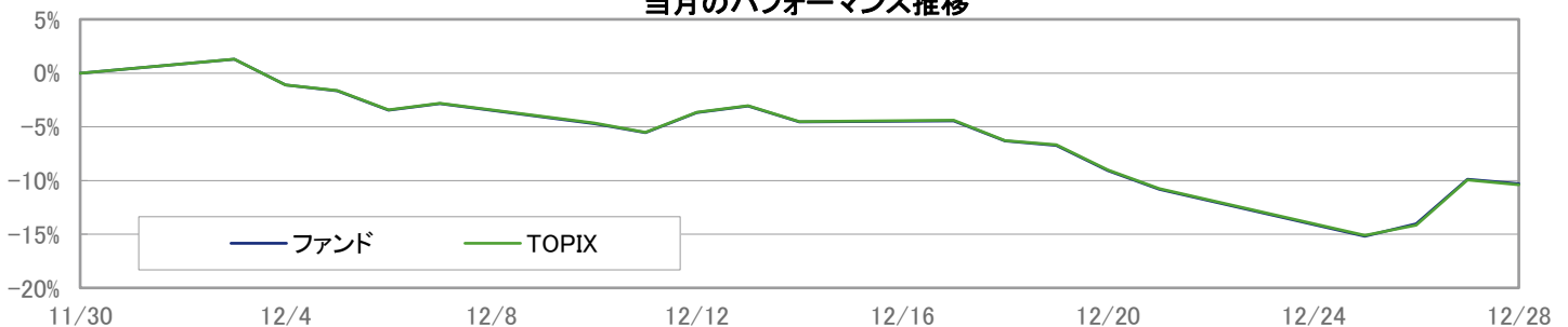
当月のパフォーマンス推移

※ 上記のグラフは過去のものであり、将来の運用成果を保証するものではありません。