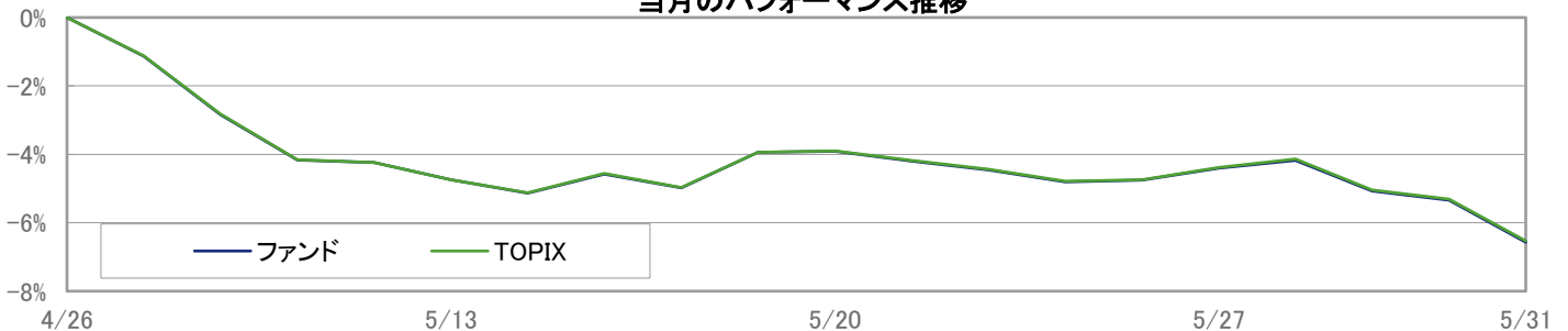
当月のパフォーマンス推移

※ 上記のグラフは過去のものであり、将来の運用成果を保証するものではありません。