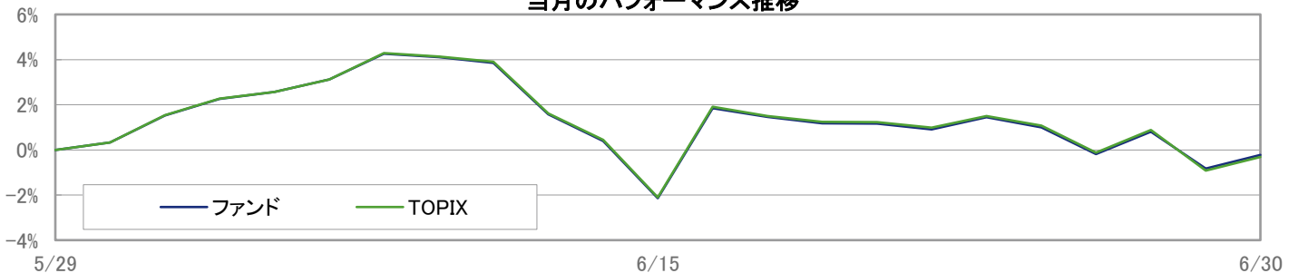
当月のパフォーマンス推移

※ 上記のグラフは過去のものであり、将来の運用成果を保証するものではありません。