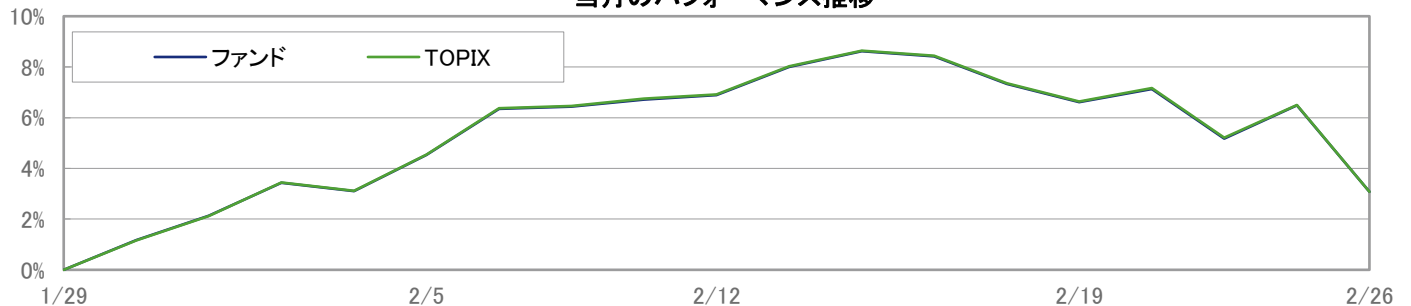
当月のパフォーマンス推移

※ 上記のグラフは過去のものであり、将来の運用成果を保証するものではありません。