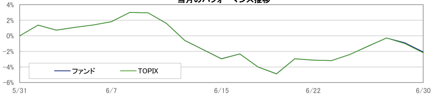
当月のパフォーマンス推移

※ 上記のグラフは過去のものであり、将来の運用成果を保証するものではありません。