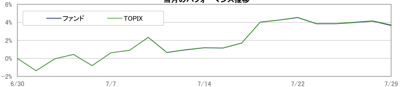
当月のパフォーマンス推移

※ 上記のグラフは過去のものであり、将来の運用成果を保証するものではありません。