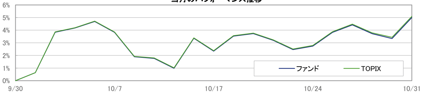
当月のパフォーマンス推移

※ 上記のグラフは過去のものであり、将来の運用成果を保証するものではありません。