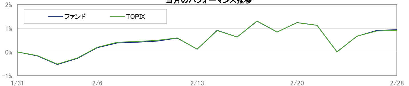
当月のパフォーマンス推移

※ 上記のグラフは過去のものであり、将来の運用成果を保証するものではありません。