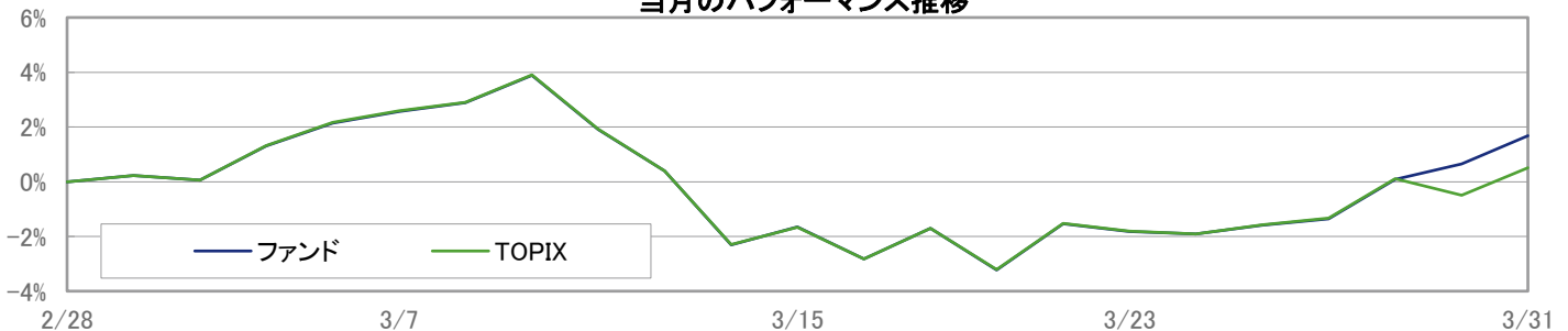
当月のパフォーマンス推移

※ 上記のグラフは過去のものであり、将来の運用成果を保証するものではありません。