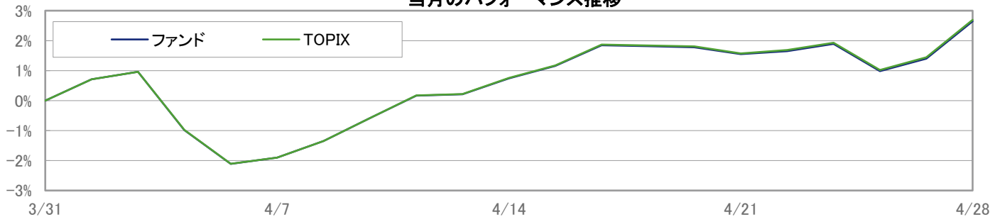
当月のパフォーマンス推移

※ 上記のグラフは過去のものであり、将来の運用成果を保証するものではありません。