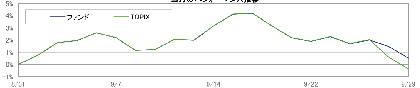
当月のパフォーマンス推移

※ 上記のグラフは過去のものであり、将来の運用成果を保証するものではありません。