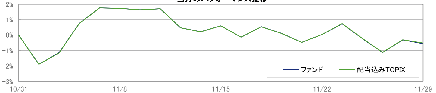
当月のパフォーマンス推移

※ 上記のグラフは過去のものであり、将来の運用成果を保証するものではありません。