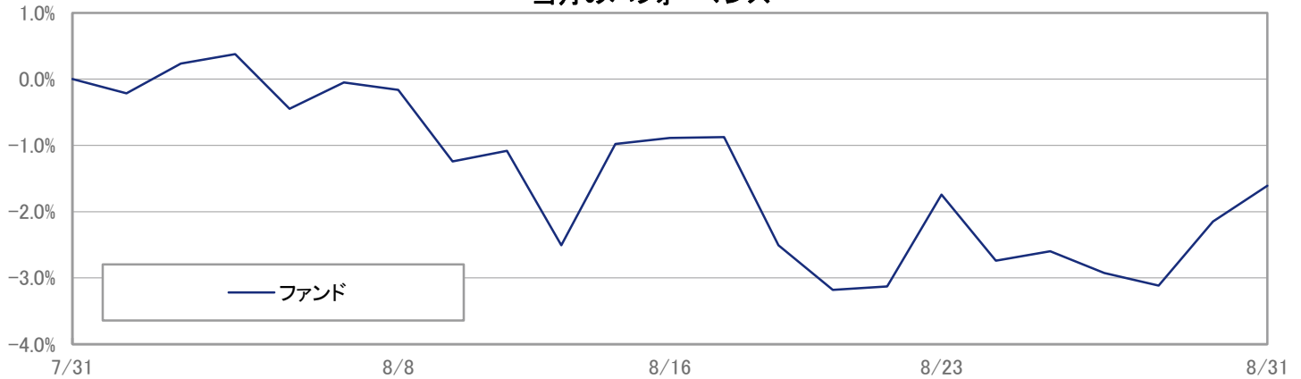
当月のパフォーマンス

※ 上記のグラフは過去のものであり、将来の運用成果を保証するものではありません。