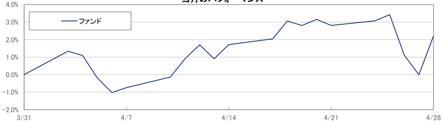
当月のパフォーマンス

※ 上記のグラフは過去のものであり、将来の運用成果を保証するものではありません。