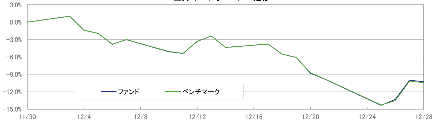
当月のパフォーマンス推移

※ 上記のグラフは過去のものであり、将来の運用成果を保証するものではありません。