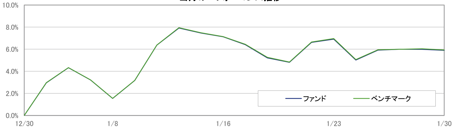
当月のパフォーマンス推移

※ 上記のグラフは過去のものであり、将来の運用成果を保証するものではありません。