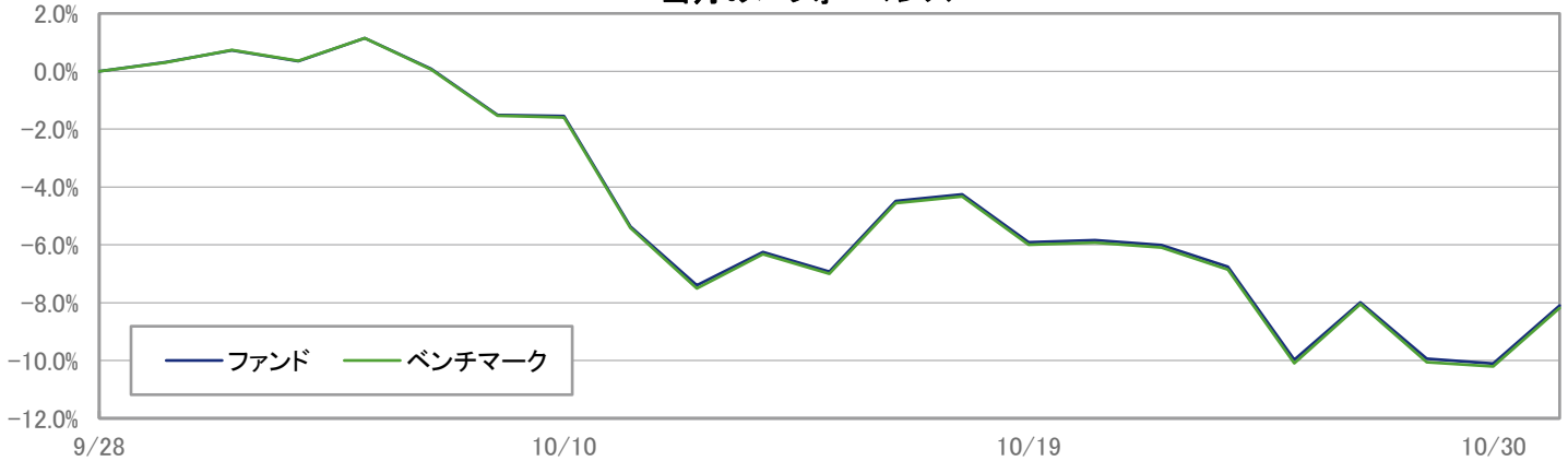
当月のパフォーマンス

※ 上記のグラフは過去のものであり、将来の運用成果を保証するものではありません。