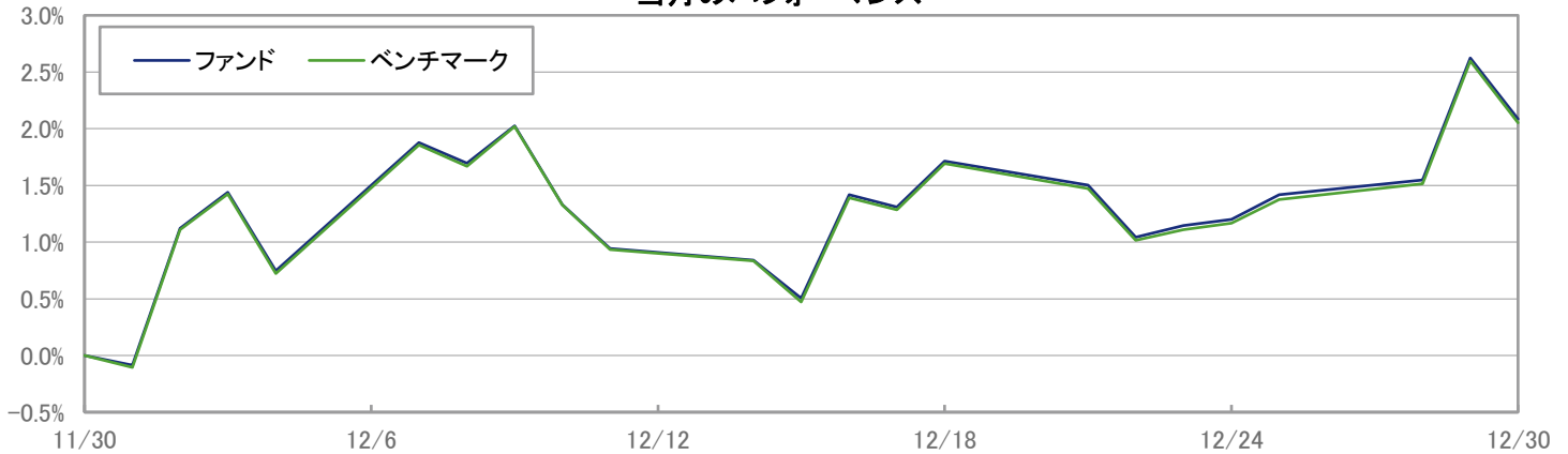
当月のパフォーマンス

※ 上記のグラフは過去のものであり、将来の運用成果を保証するものではありません。