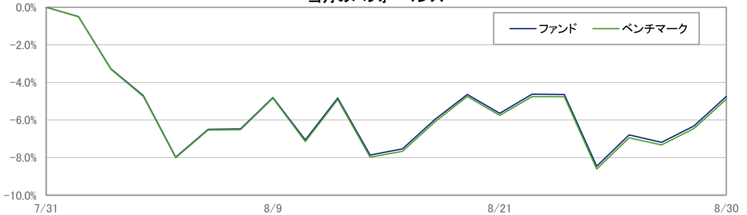
当月のパフォーマンス

※ 上記のグラフは過去のものであり、将来の運用成果を保証するものではありません。