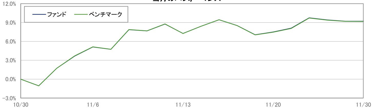
当月のパフォーマンス

※ 上記のグラフは過去のものであり、将来の運用成果を保証するものではありません。