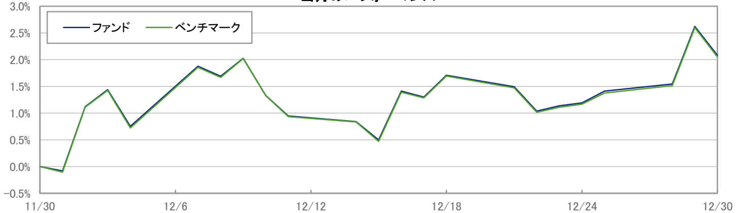
当月のパフォーマンス

※ 上記のグラフは過去のものであり、将来の運用成果を保証するものではありません。