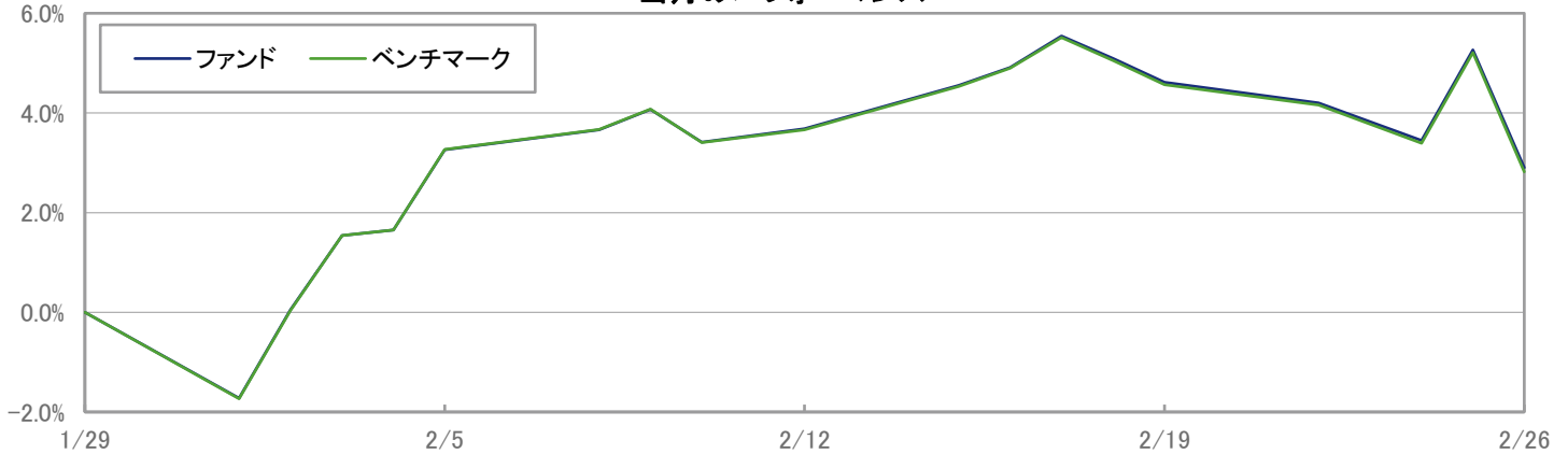
当月のパフォーマンス

※ 上記のグラフは過去のものであり、将来の運用成果を保証するものではありません。