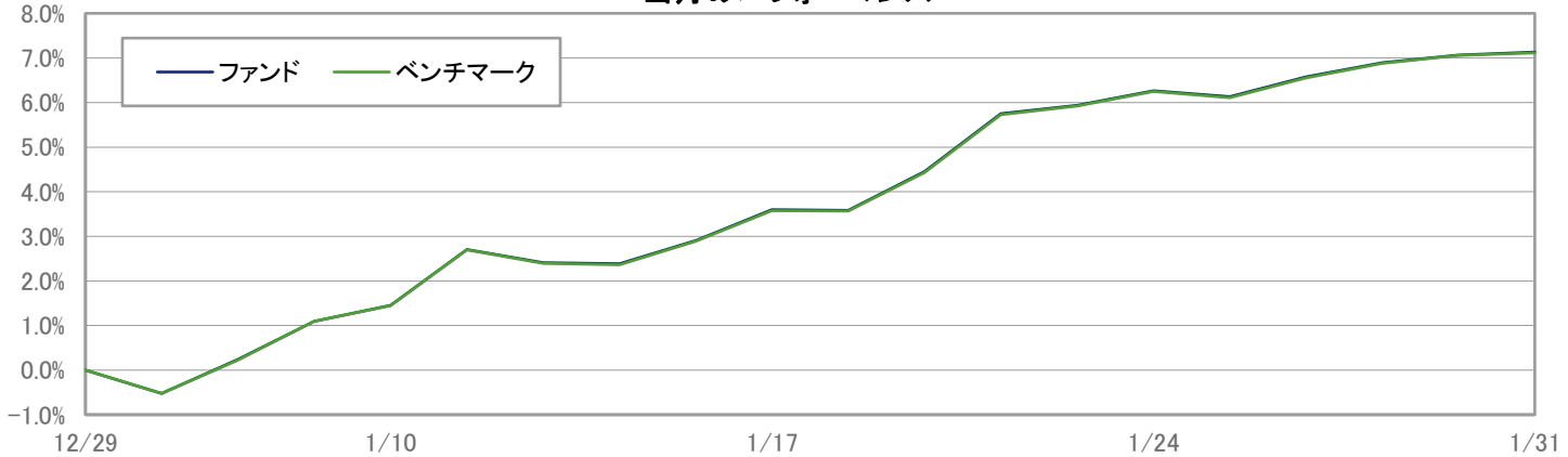
当月のパフォーマンス

※ 上記のグラフは過去のものであり、将来の運用成果を保証するものではありません。